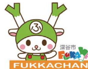
深谷市イメージキャラクター ふっかちゃん

当日は、ふっかちゃんも定時退社! ふっかちゃん横丁に登場! (18:00頃予定)