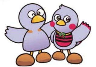
埼玉県のマスコット 「コバトン&さいたまっち」